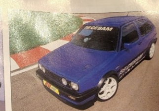
GOLF 2 CESAM