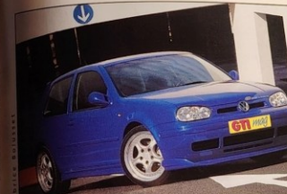
GOLF 4 DP SPORT