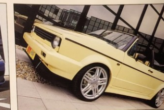
GOLF 1 CABRIOLET